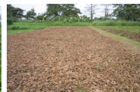
Couverture morte de Pueraria sp

L'herbicidage s'effectue avec un pulvérisateur dorsal d'une capacité de 15 litres réglé à la pression de 2 bars. La hauteur de traitement de la buse est de 40 cm au dessus de la couverture.