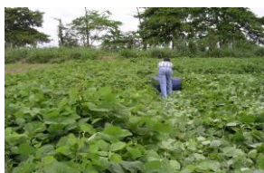
Roulage de Pueraria sp avant Herbicidage