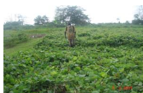
Herbicidage Pueraria sp