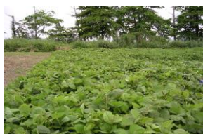
Couverture de Pueraria sp

Le roulage au fût et l'herbicidage de la couverture de Pueraria sp constituent les principales opérations de la préparation de la couverture morte.