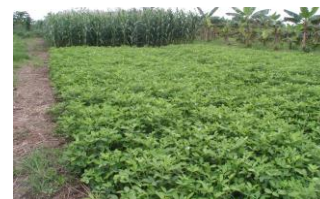
Arachide de 2 mois sur Couverture morte de Pueraria